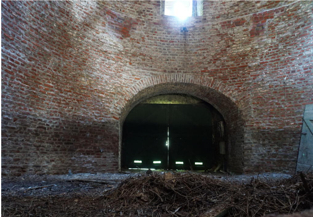
Innenansicht, EG, Blick zum W-Eingang, Foto: Dr. Ralf Kreiner, 4.5.2018.