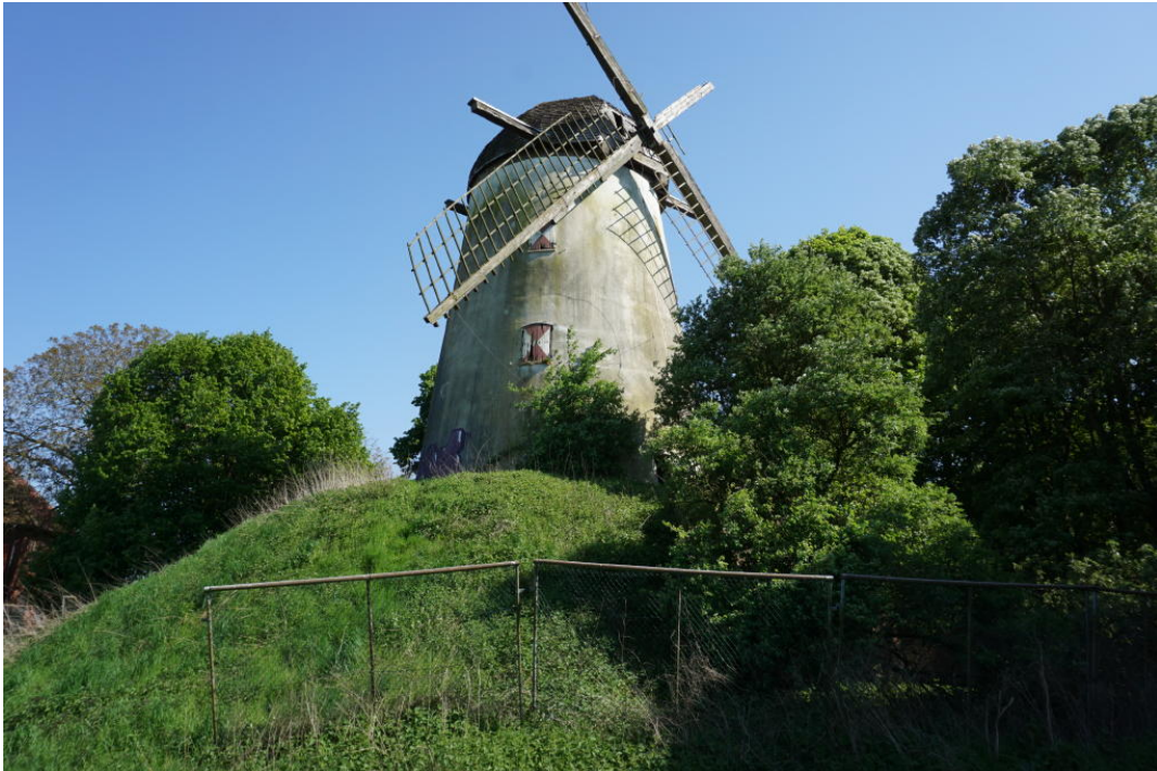
Ansicht der Mühle mit dem Mühlenwall von NW. Foto: Dr. Ralf Kreiner, 4.5.2018